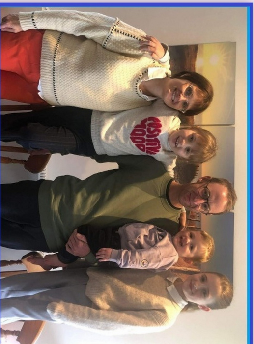
1ste Zonaal Jaarse Vierzon 858 D. 17-05-2025 1ste Zonaal Oude Bourges 1028 D. 14-06-2025 1ste Zonaal Oude Tulle 252 D. 02-08-2025 1ste Zonaal Oude Bourges 166 D. 23-08-2025